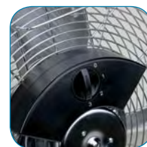
Переключатель скоростей / Ручка для переноски