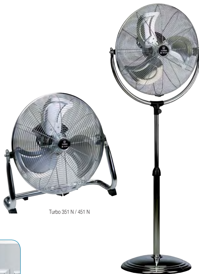
Turbo 351 N / 451 N