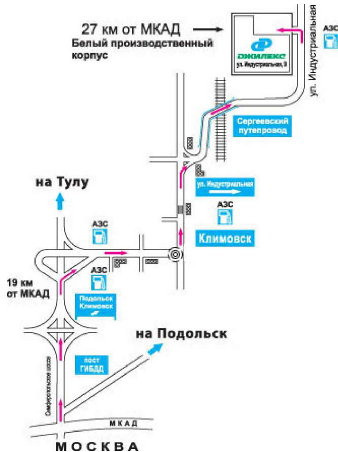
СХЕМА ПРОЕЗДА ОТ МОСКВЫ

Завод изготовитель. Сервисный центр Зал оптово-розничной торговли