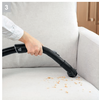
3 Съёмная насадка для пола