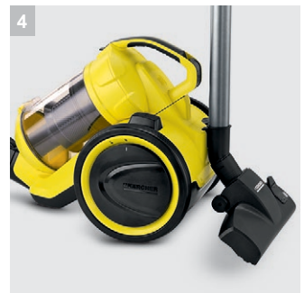
4 Парковочная позиция