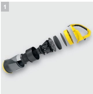
1 Мультициклонный фильтр

Больше не нужно менять фильтр-мешки, а тем более покупать: Циклонный пылесос без мешка Керхер VC 3 с прозрачным контейнером, который можно мыть.