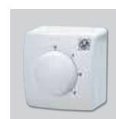
Настенный пульт управления. Размеры ДхШхВ (мм): 80x80x70

Вентиляторы очень просты в установке, имеют три скорости вращения и трехскоростной настенный проводной пульт управления в комплекте. В зависимости от схемы подключения, вентилятор может работать с потоком воздуха вниз или вверх.