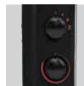
Ручка управления и термостат

Для увеличения потока воздуха через конвектор, модель TLS-503 укомплектована встроенным вентилятором на передней панели. Обе модели подходят для настенной установки.