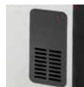
Принудительное движение воздуха TLS-503T