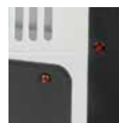
Световой индикатор работы