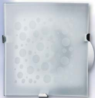
Ice 100 Ice 125 Ice 150