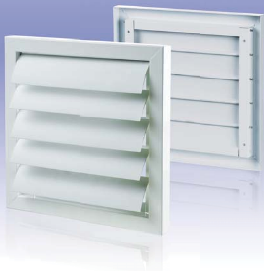
Вентиляционная решетка с гравитационными жалюзи